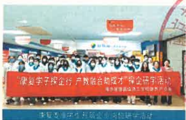
“康复学子探企行 产教融合助成才” 校企研学活动