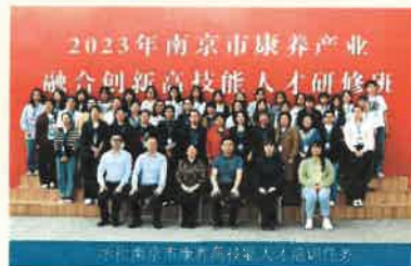
2023年南京市康养产业融合创新高技能人才研修班