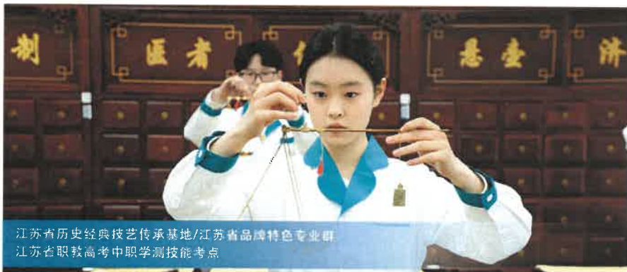
江苏省历史经典技艺传承基地/江苏省品牌特色专业群 江苏省职教高考中职学测技能考点