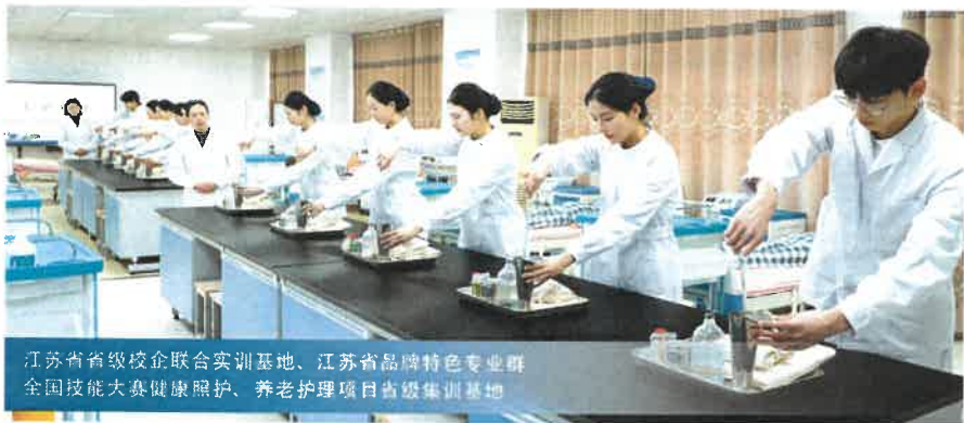
江苏省省级校企联合实训基地、江苏省品牌特色专业群 全国技能大赛健康照护、养老护理项目省级集训基地