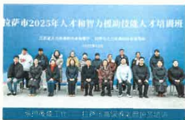
拉萨市2025年人才和智力援助技能人才培训班