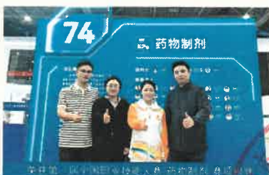
第74届“全国职业院校技能大赛”药品调剂赛项一等奖