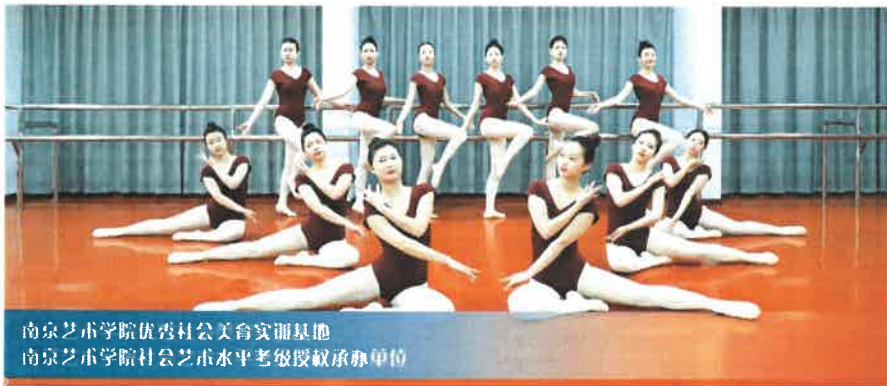
南京艺术学院优秀社公美育实训基地 南京艺术学院社公艺术水平考级授权承办单位