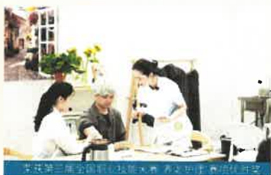
荣获第三届全国职业技能大赛养老护理赛项优胜奖