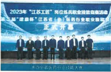
2023年“江苏工匠”岗位练兵职业技能竞赛活动 第三届“建康杯”江苏省(含)医药行业职业技能大赛 正式开幕