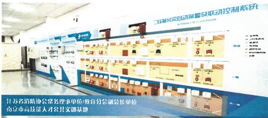
江苏省消防协会常务理事单位/教育分会副会长单位 南京市高技能人才公共实训基地