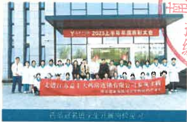
医药类赛项学生竞赛指导教师