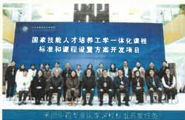
国家技能人才培养工学一体化课程 标准和课程设置方案开发项目