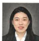
士子附 省技术能手 市专业带头人